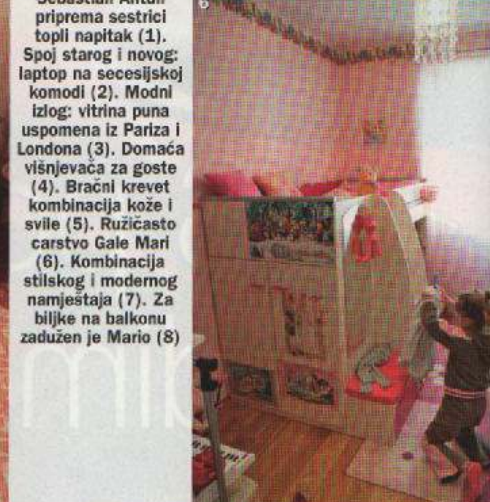
Sebastian Antun priprema sestrici topli napitak (1). Spoj starog i novog: laptop na secesijskoj komodi (2). Modni izlož: vitrina puna uspomena iz Pariza i Londona (3). Domaća višnjevača za goste (4). Bračni krevet kombinacija kože i svile (5). Ružičasto carstvo Gale Mari (6). Kombinacija stilskog i modernog namještaja (7). Za biljke na balkonu zadužen je Mario (8)