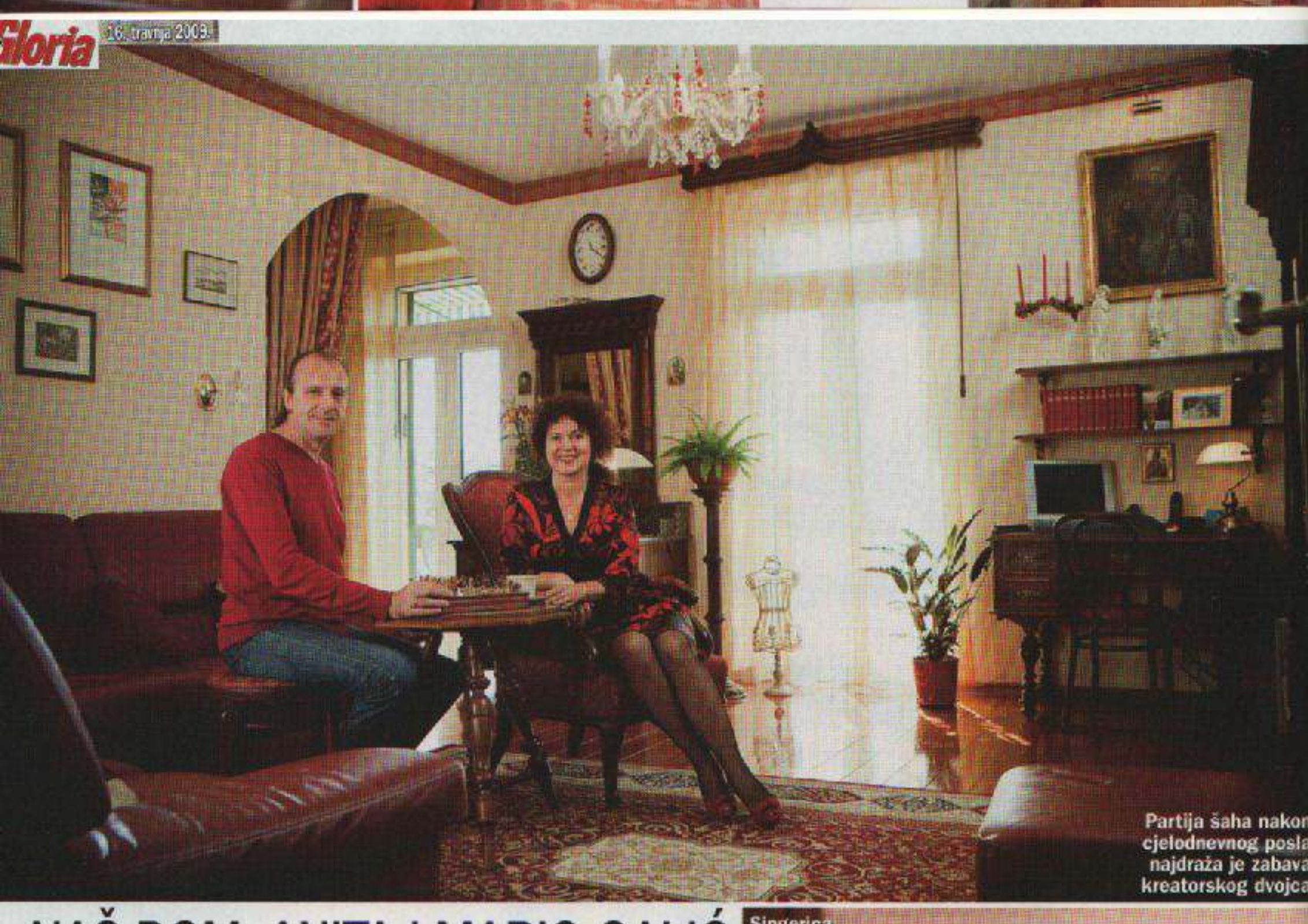
Partija šaha nakon cjelodnevnog posla najdraža je zabava kreatorskog dvojca